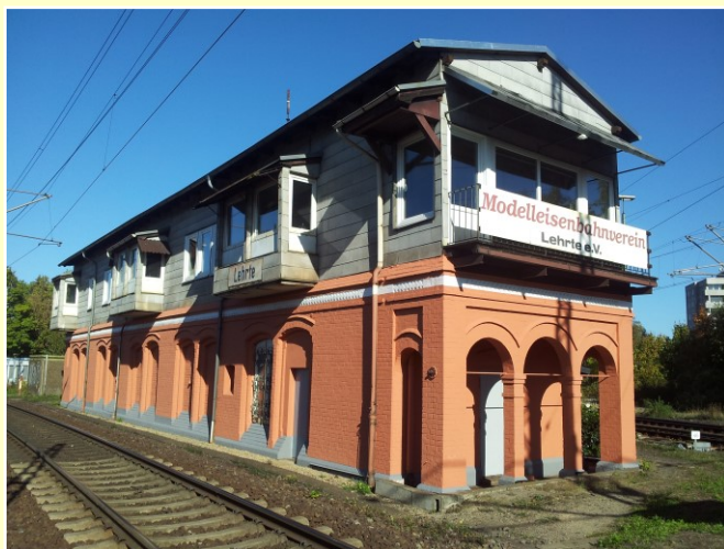
Museumsstellwerk Lpf in Lehrte, Richtersdorf 1

Ihre Mitgliedschaft oder Ihre Spende ist wichtig für die Erreichung des Vereinsziels. Helfen Sie uns beim Erhalt des Stellwerks Lpf, einer Erinnerung an ein vergangenes Eisenbahnzeitalter in Lehrte.