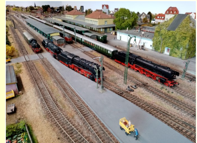
HO-Modell vom Lehrter Personenbahnhof um 1960

Im Erdgeschoss wurden umfangreiche Renovierungsarbeiten durchgeführt. Für die 21 Meter lange und 3 Meter breite Modelleisenbahn des Lehrter Personenbahnhofs um 1960 wurde der ehemalige Spannwerksraum komplett umgebaut. Zahlreiche Gebäudemodelle, die digitale DCC-Modellbahnsteuerung, das PC-Programm RAILWARE®, eine LED-Lichtanlage, umfangreiches Gleis- und Fahrzeugmaterial sind bereits im Einsatz. Die Decoder-Programmierung und alle Dokumentationen werden in der Werkstatt zum Teil an Computern durchgeführt.