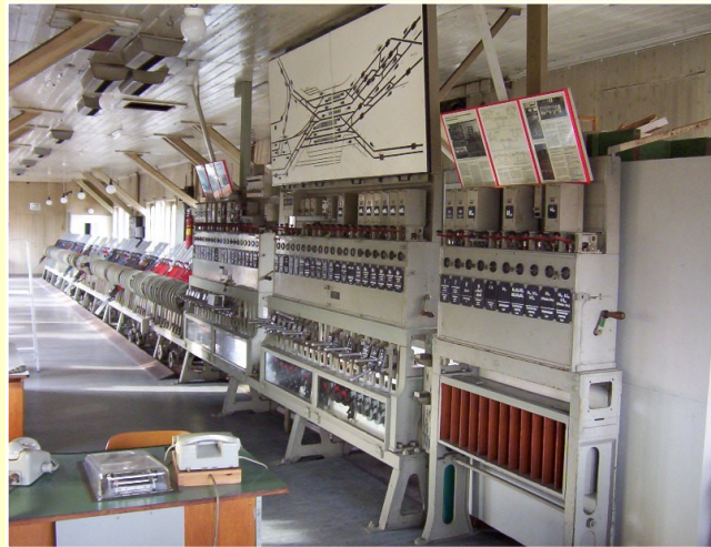
Blockwerk und Hebelbank im Museum im Obergeschoss

Seit seiner Stilllegung im Oktober 1986 werden die mechanischen Zugsicherungseinrichtungen von den Mitgliedern gepflegt. In mühevoller Kleinarbeit wird die Lehrter Eisenbahngeschichte konserviert und somit für Besucher und Eisenbahninteressierte betriebsbereit gehalten. Mit der Technik, zum Teil aus dem Jahre 1912 (Bauart Jüdel), können heute wieder Fahrstraßen gestellt werden. Durch das Bedienen der Weichen- und Signalhebel und der mechanischen Sicherungstechnik ist das alte Eisenbahnzeitalter „spürbar“.